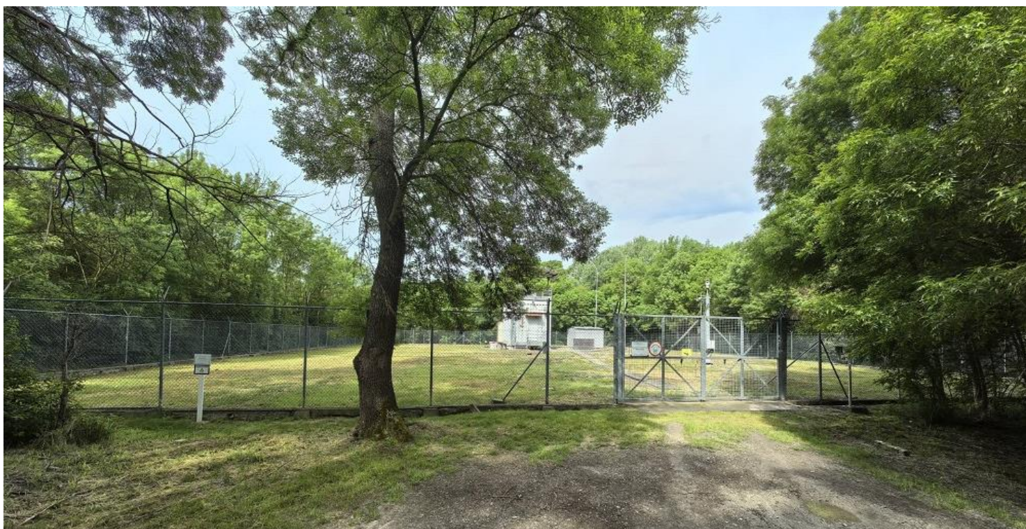
артезианская скважина №2 (общий вид)