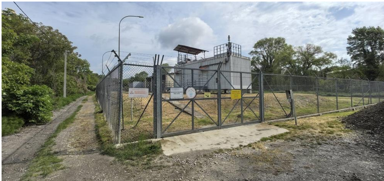
артезианская скважина №1 (общий вид)